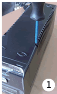
1 把機器翻轉倒放使用十字螺絲起子打開底板四個螺絲。

可自行更換電池，提供個人用戶更彈性方便的貼心設計 (下列圖是為標準型機種，其更換方式相同)