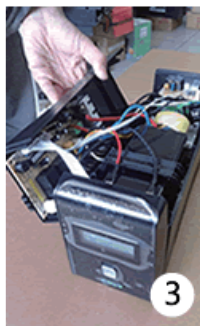
3 把開背蓋放到側邊，讓內部整個打開來。