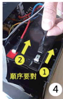
4 先拔除與電池連接的負端線(黑色1)，再拔正端(紅色2)。(接回去時先1後2)