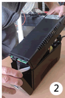
2 把面板稍微拉開，並同時掀開背蓋。