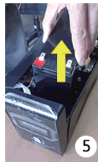
5 將電池取出，並置入新的同規格電池，接上連接線。