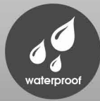
防塵防水等級IP65 AR-CPI-888/AR-CPO-888/ AR-888W