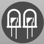
炫彩LED AR-CPI-888/AR-CPO-888 AR-888W