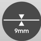
超薄嵌入安裝 AR-CPI-888/AR-CPO-888/ AR-888W