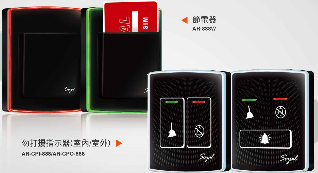
◀ 節電器 AR-888W